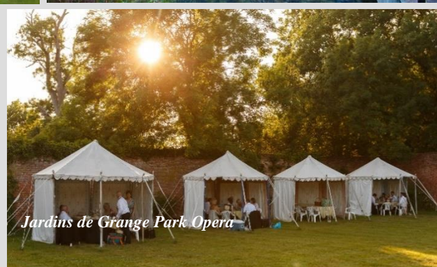
Jardins de Grange Park Opera