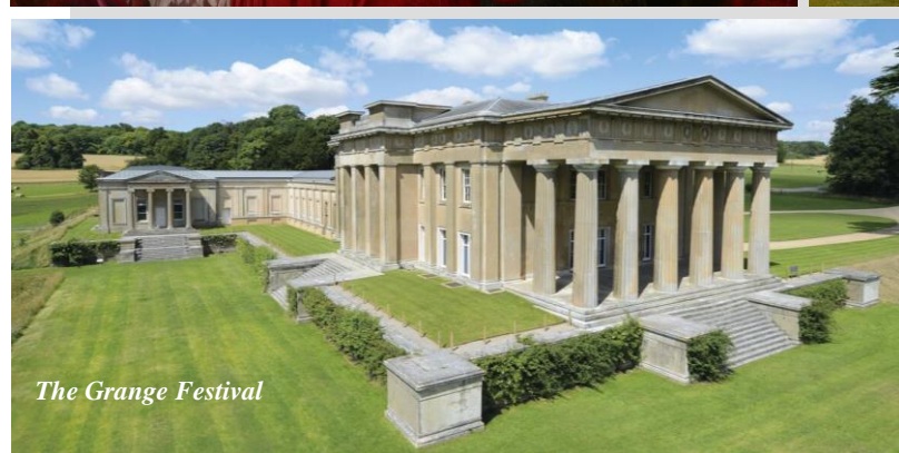
The Grange Festival