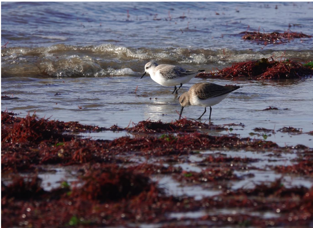
Bécasseaux sanderling et variable, Côte atlantique française.